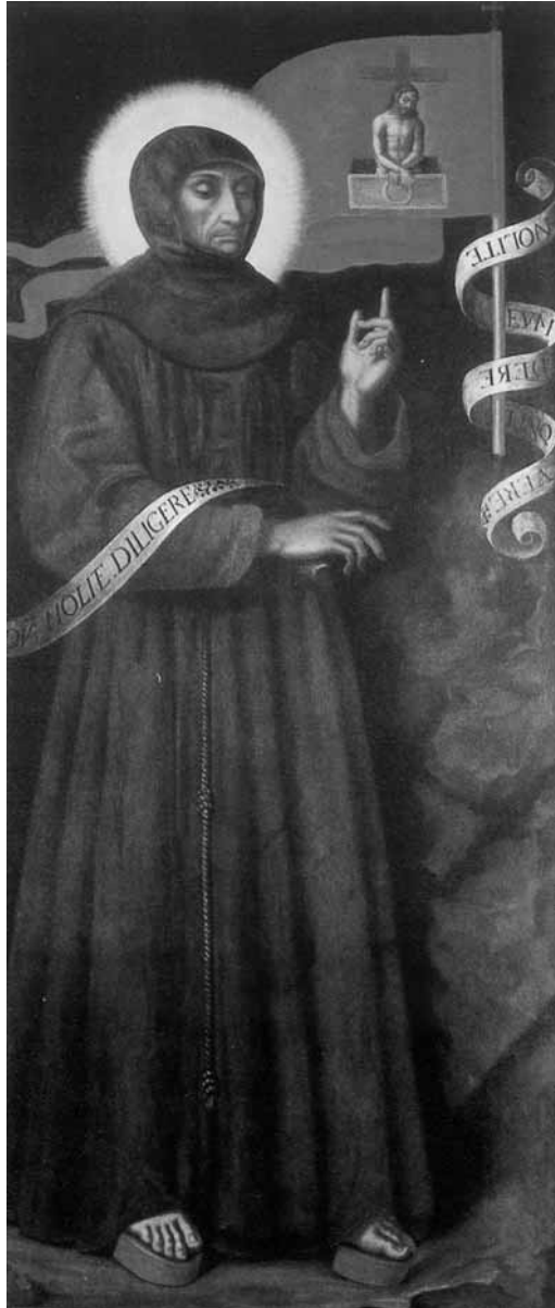
fig. 2: Il beato Bernardino da Feltre . Piacenza, Cassa di Risparmio di Parma e Piacenza.