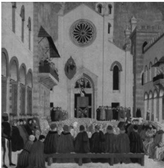
fig. 5: Bottega degli Erri, Storie di san Vicent Ferrer: la predica di Perpignano . Oxford, Ashmolean Museum.