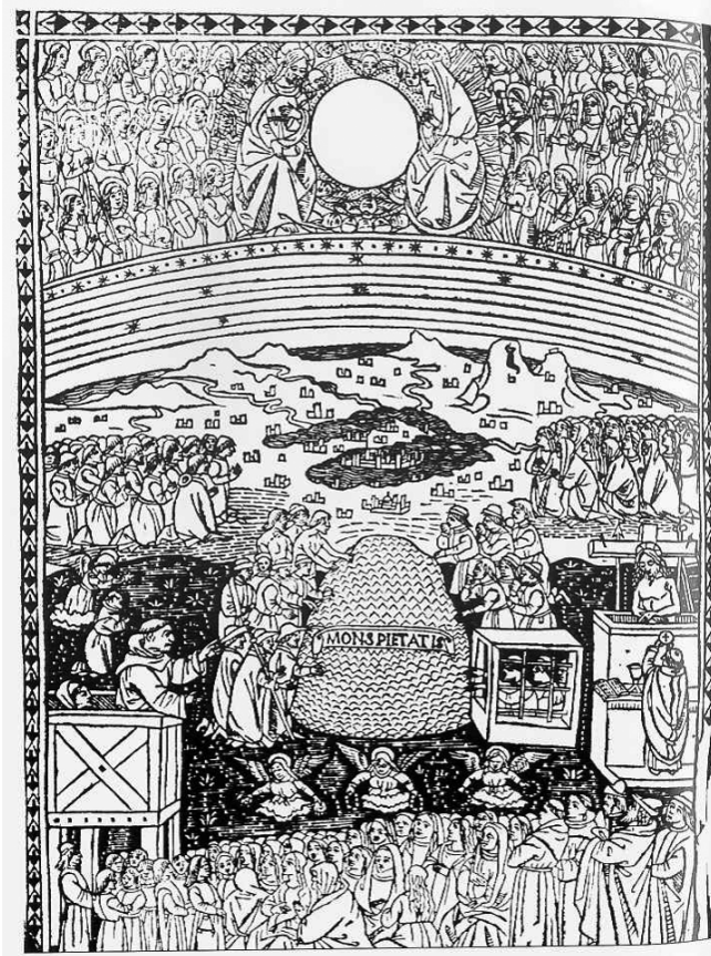
fig. 1: Marco da Montegallo, La tabula della salute . Firenze, A. Miscomini, 1494.