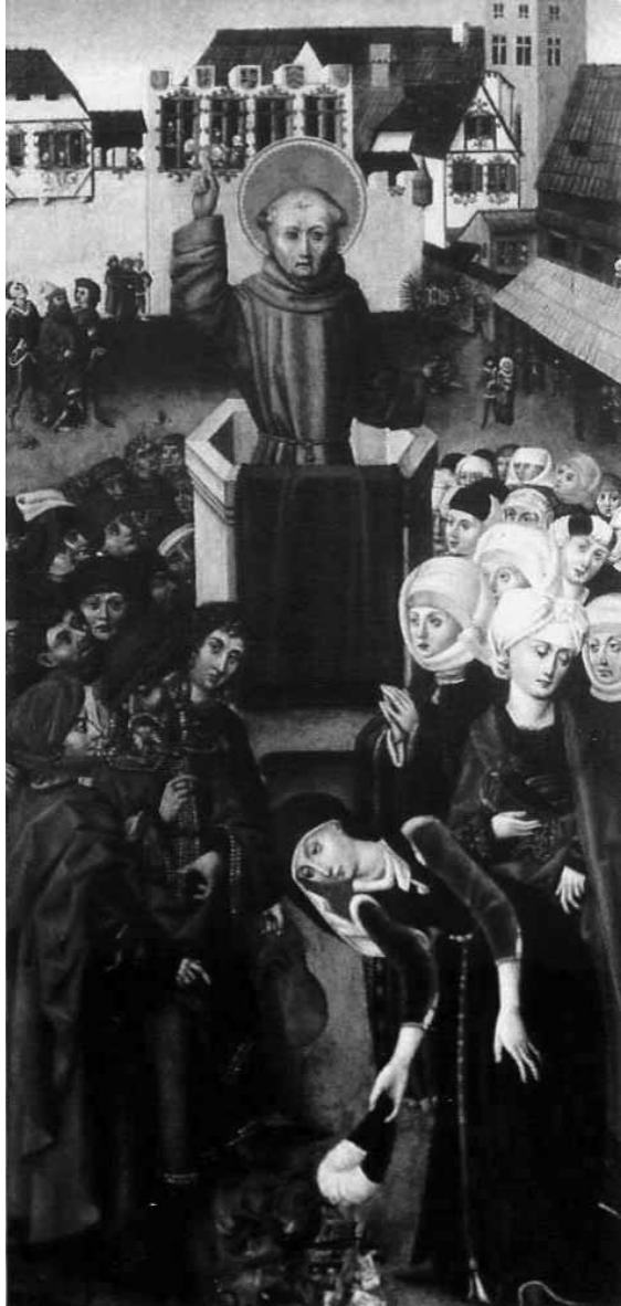
fig. 4: Sebald Popp, Predica del beato Giovanni da Capestrano a Norimberga . Bamberg, Historisches Museum.