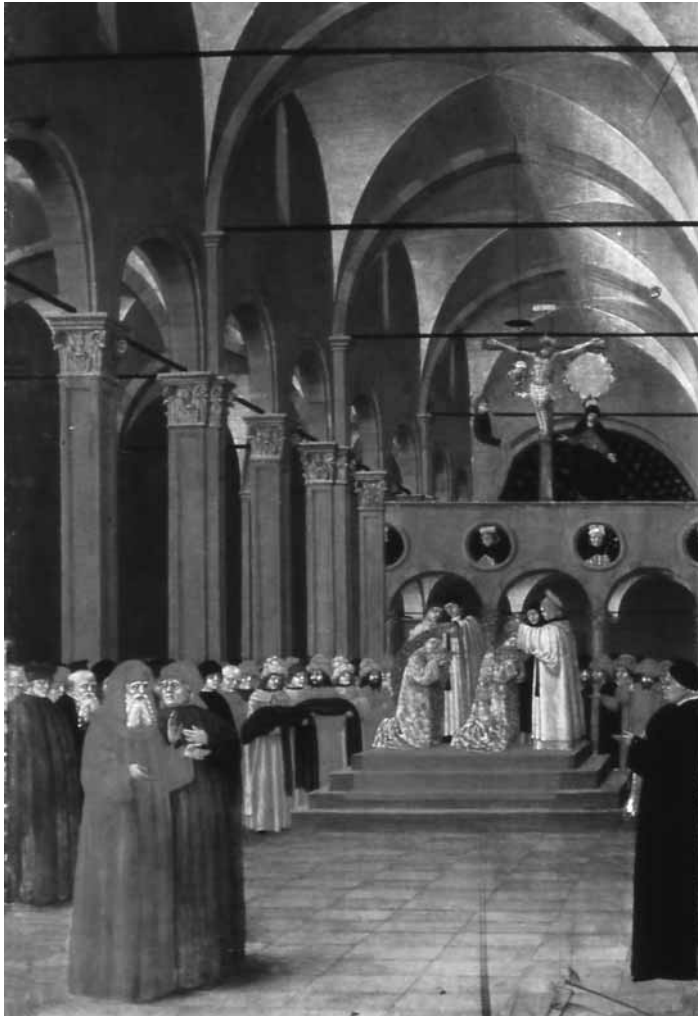
fig. 6: Bottega degli Erri, Storie di san Vicent Ferrer: il battesimo di due ebrei . Wien, Kunsthistorisches Museum.